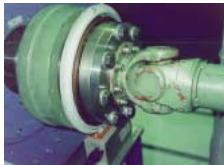
1: Drehmomentmessflansch des Typs T10F mit direkt angeflanschter Gelenkwelle

Eine zentrale Rolle in der ökonomischen und ökologischen Weiterentwicklung von Kfz-Bordnetzen ist deshalb die Optimierung von Gewicht und Wirkungsgrad der Komponenten, bei denen elektrische Energie in mechanische (Elektromotoren) bzw. mechanische in elektrische Energie (Gene-